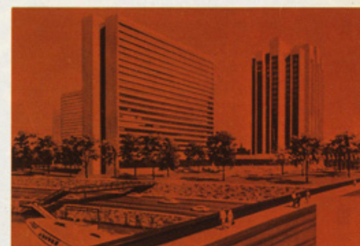
Центр международной торговли и научно-технических связей СССР с зарубежными странами

любой из выставочных павильонов так, что работа одной выставки не будет мешать подготовке другой. При этом проект предусматривает новейшие средства автоматизации и механизации почти всех процессов выставочных работ.